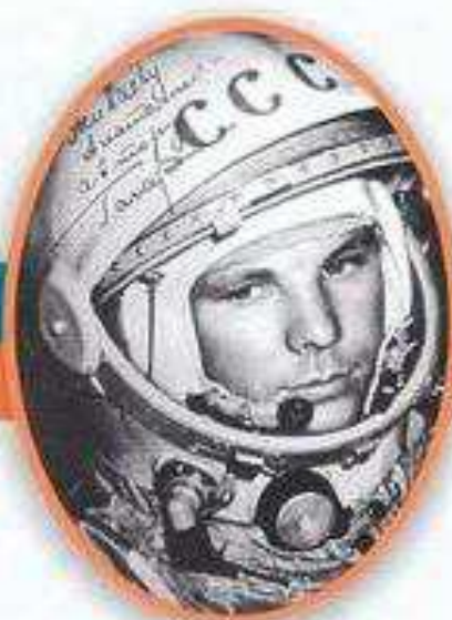
Юрий Алексеевич Гагарин Первый космонавт