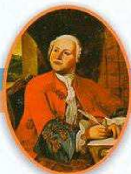
Михаил Васильевич Ломоносов Великий русский ученый

Ты, конечно же, вспомнишь, что Александр Сергеевич Пушкин написал много прекрасных стихов и чудесные сказки: «Сказка о царе Салтане», «Сказка о рыбаке и рыбке», «Сказка о мертвой царевне и о семи богатырях», «Сказка о золотом петушке». Петр Ильич Чайковский писал необыкновенно красивую музыку, создал цикл пьес «Времена года» и хорошо знакомый тебе «Детский альбом». Михаил Васильевич Ломоносов — великий русский ученый, он многого добился в самых разных областях знаний: литературе и искусстве, физике и астрономии, географии и истории. Им сделано много важных научных открытий. Юрий Алексеевич Гагарин был первым космонавтом, первым человеком, облетевшим на космическом корабле «Восток-1» нашу планету.