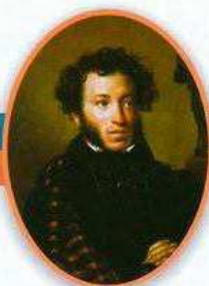
Александр Сергеевич Пушкин Великий русский поэт