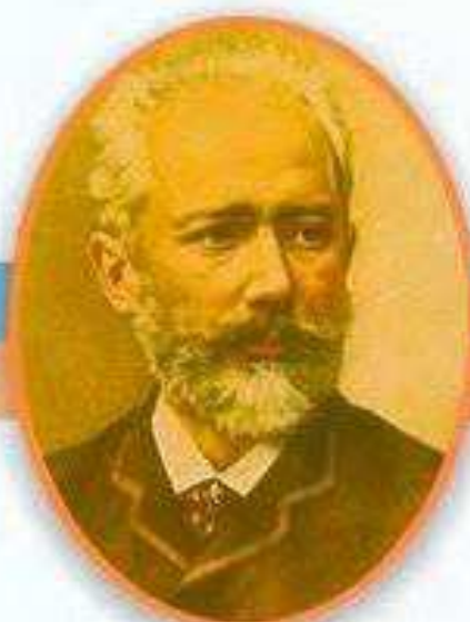
Петр Ильич Чайковский Великий русский композитор